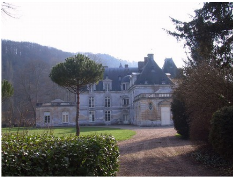
Le château vu depuis le sud