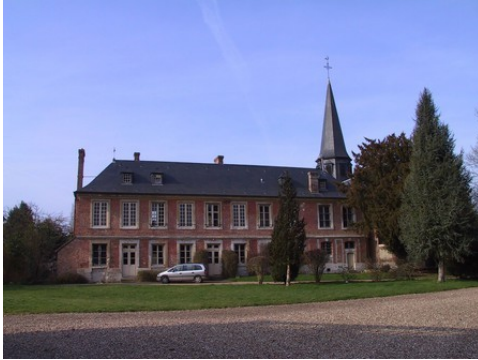
Le petit château (logis) et l'église