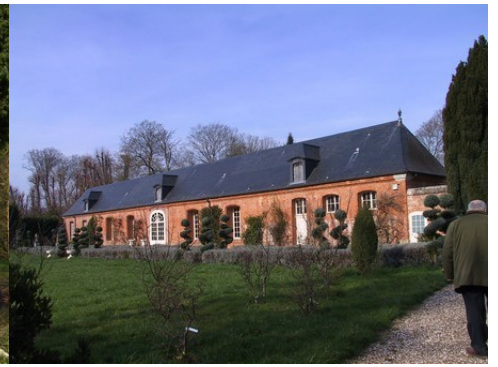
L'orangerie du château