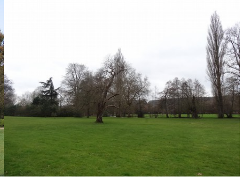
Le parc avec vue sur la vallée

Pour la zone en rose foncé dans le périmètre de 500m