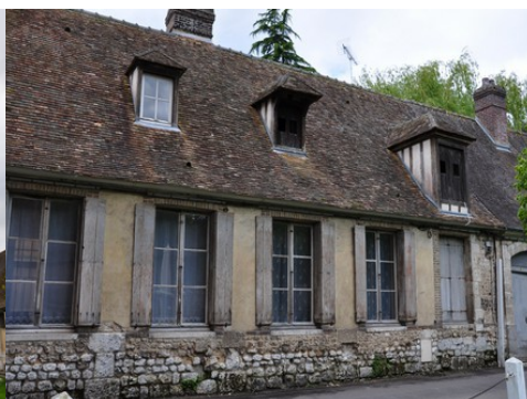
D'autres exemples de maisons aux abords