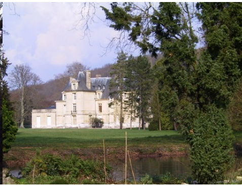
Le château et son parc, depuis l'Iton